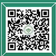
秘书处 会员服务与管理 订阅号