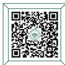
秘书处 学术交流 与环保技术推介平台