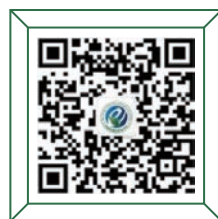
秘书处 中国环境院所长论坛