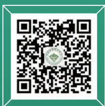
中国环境科学 官方公众号