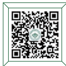
秘书处 环保与健康 产学研用